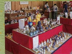
※写真は昨年の様子です。