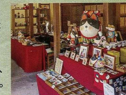
※写真は昨年の様子です。