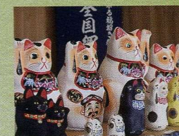
※写真は昨年の様子です。

各地で伝統的に作られている招き猫です。現在も受け継がれているものから、入手困難なものまで、招き猫まつり限定で販売する招き猫もご紹介します。