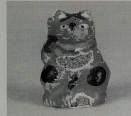
鴻巣練り人形(埼玉県) 高さ70ミリ