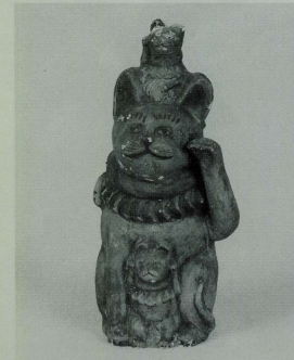
伏見人形(京都府) 高さ310ミリ