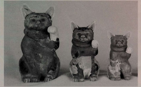
「藤枝招き猫」に使われていた原型(明治時代前期)