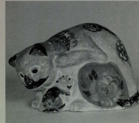
花巻人形(岩手県) 高さ150ミリ