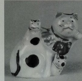
瀬戸焼(愛知県) 高さ533ミリ